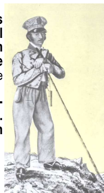
Joseph Naus 1820